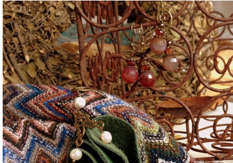
Achat- und Perlenohrringe sowie Loop von Vogelwild Manufaktur