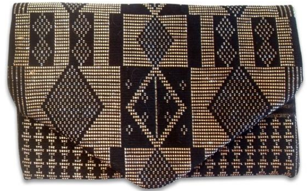
Elegante Envelope-Clutch im Metallic-Grafic-Look