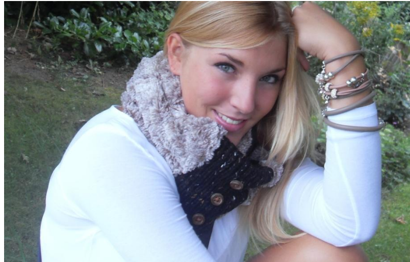
Loop und Armbänder von Vogelwild Manufaktur